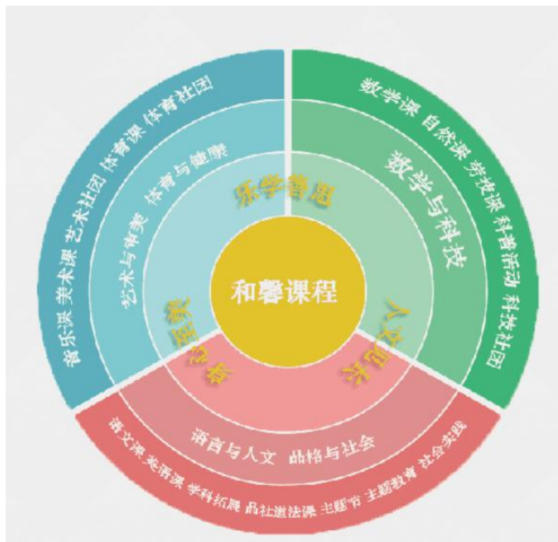
图1 古猗小学“和馨课程”图谱

学校“和馨课程”课程群是一个面向全体，关注个体，以“多元、丰富、特色”的课程为载体，让学生在美好的体验中健康成长的有机课程体系。涵盖品格与社会、语言与人文、数学与科技、艺术与审美、体育与健身五大领域内容，让学生在课程中发展个性，在学习体验快乐，在自信中健康成长。